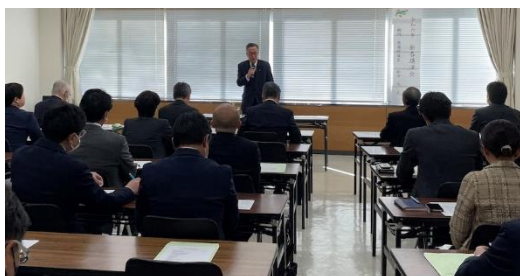
祝 宇都宮卸商業団地協同組合 新春賀詞交歓会

2024年1月12日(金)当組合の顧問、船田元先生による新春講演会を開催いたしました。年始に発生した能登半島沖地震の対応、日本の山積みとなっている政治経済問題、国際情勢と様々な内容のご講演を頂きました。誠にありがとうございました。賀詞交歓会も開催することができ、どちらも有意義な時間を過ごす事が出来ました。